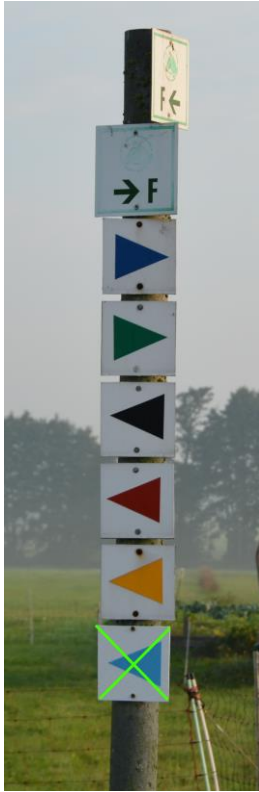
Bild links: Blau und Grün geht nach rechts, Schwarz, Rot und Gelb nach links. (Hellblau haben wir diesmal nicht dabei.)

Geritten wird auf einem fest markierten Reitwegenetz. Die Markierungen sind größtenteils direkt an den Bäumen angebracht, manchmal gibt es Hilfsmarkierungen, wo keine Bäume stehen. Als Markierung dienen Dreiecke in den Farben des jeweiligen Loops. Die Spitze zeigt immer in Ritt-Richtung. Beispiel: